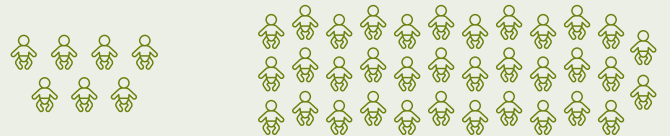
مع العلاج الوقائي: 7

من بين 1000 رضيع أصغر من 8 أشهر، يجب أن يحصل على العلاج في المستشفى بسبب الإصابة بالفيروس المخلوي التنفسي: